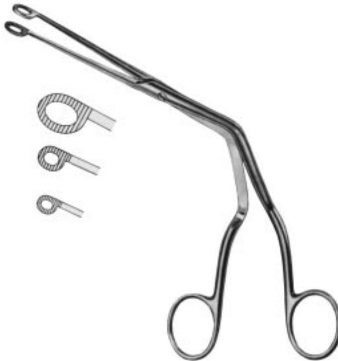
MAGILL 11.0300 24 cm 11.0302 20 cm 11.0304 17 cm