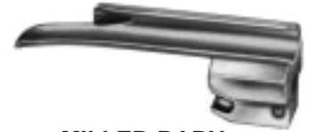
MILLER-BABY 11.2070 55 mm Fig. 0