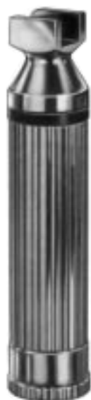
11.2016 BATTERIEGRIFF 30 mm Ø ohne Batterien without batteries sans piles sin pilas senza pila