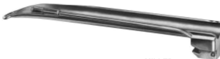
MILLER 11.1074 180 mm Fig. 4