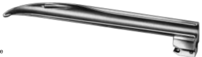
MILLER-BABY 11.2074 180 mm Fig. 4