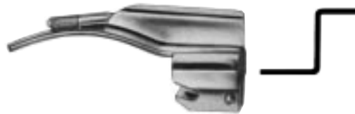
McINTOSH 11.1020 55 mm Fig. 0