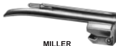
MILLER 11.1071 80 mm Fig. 1