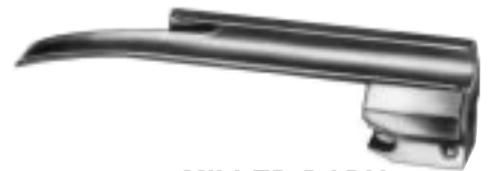
MILLER-BABY 11.2071 80 mm Fig. 1