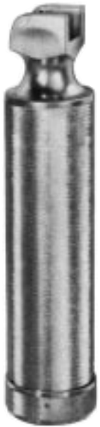
11.1016 BATTERIEGRIFF 30 mm Ø ohne Batterien without batteries sans piles sin pilas senza pila