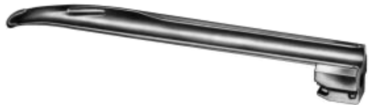
MILLER-BABY 11.2073 170 mm Fig. 3