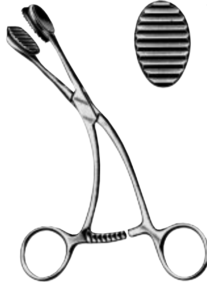
YOUNG 11.0110 16 cm