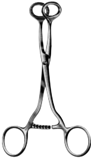
COLLIN 11.0100 17 cm

Zungen- und Kathetereinführungszangen Tongue Holding- and Catheter Introducing Forceps Pinces tire-langue et pour introduire les sondes Pinzas tiralengua y para catéteres Pinze per lingua e per introdurre le sonde