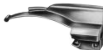
McINTOSH 11.2020 55 mm Fig. 0