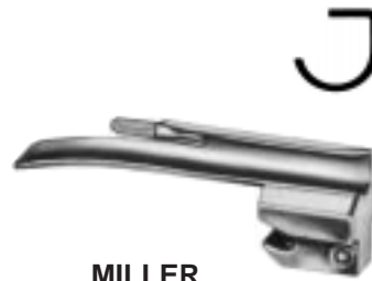
MILLER 11.1070 55 mm Fig. 0