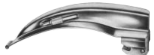
McINTOSH 11.1023 110 mm Fig. 3