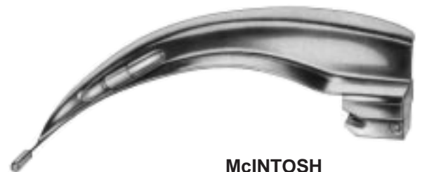
McINTOSH 11.1024 130 mm Fig. 4