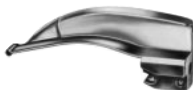
McINTOSH 11.2021 70 mm Fig. 1