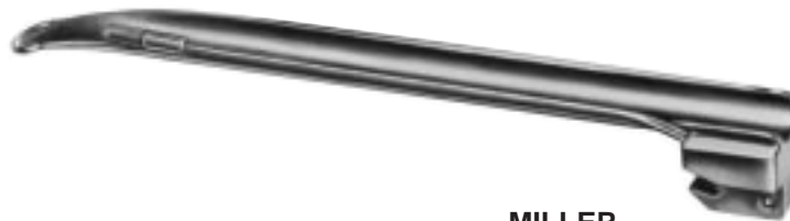
MILLER 11.1073 170 mm Fig. 3