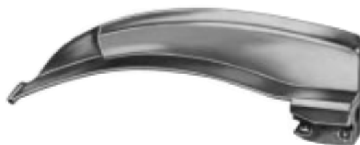
McINTOSH 11.2023 105 mm Fig. 3