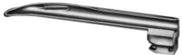
MILLER-BABY 11.2072 130 mm Fig. 2